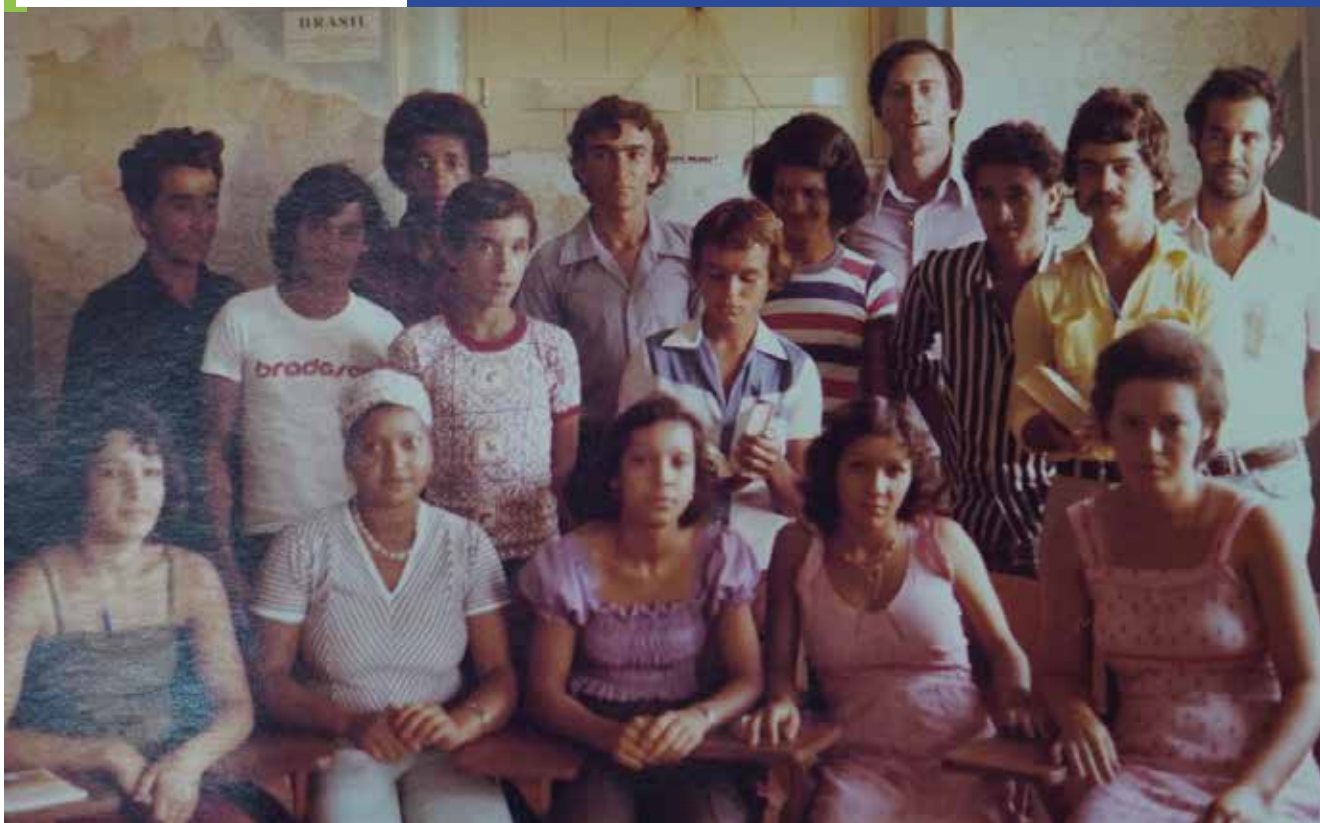
3ª turma de alternantes da ECR (1978)

É nessa visão de conjunto de uma pastoral orientada para o crescimento de comunidades cristãs, que se insere o Projeto da Escola Comunidade Rural - ECR, com o objetivo de formar agricultores que possam orientar suas comunidades no setor agropecuário, tornando-se líderes nelas.