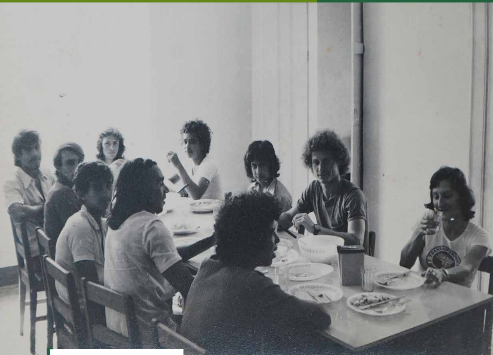
Alternantes e monitores consumindo produtos da horta