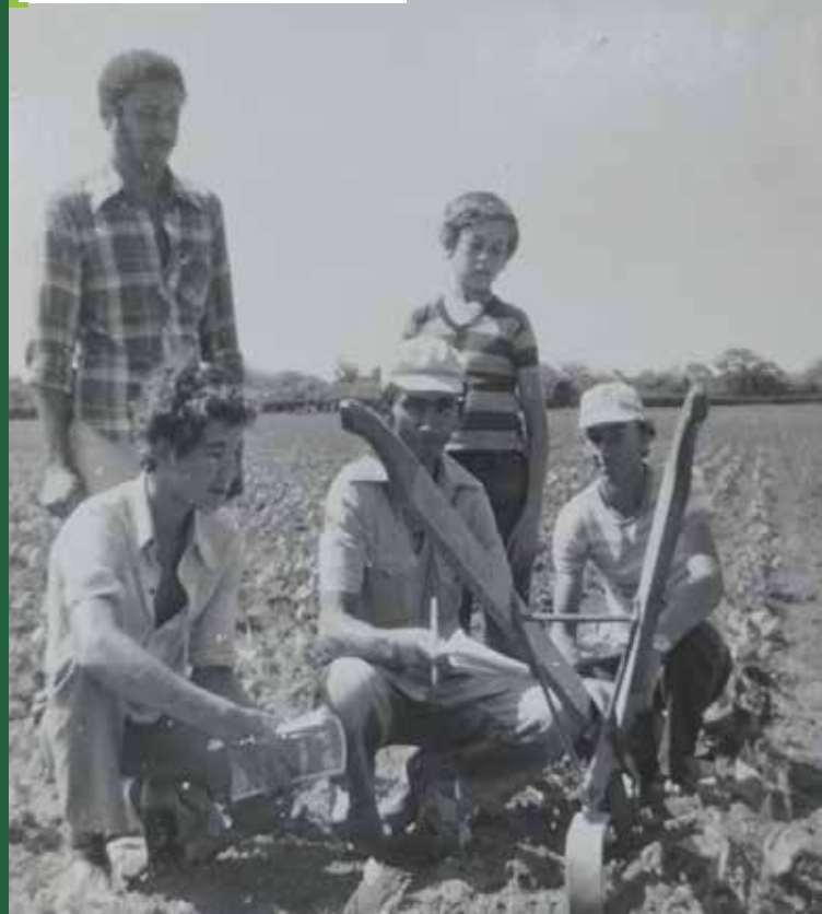
Alternantes observando arado em Visita de Estudo

Em relação a vida profissional, o estudante sempre trabalhou tanto na agricultura como na pecuária, introduzindo novas técnicas (imagem GOV049), mas sempre respeitando e aprimorando os saberes e técnicas já existentes na família e comunidade.