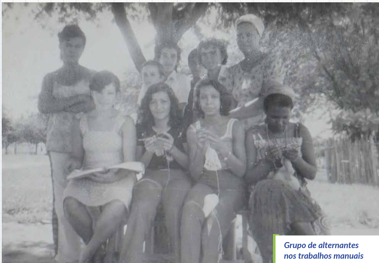
Grupo de alternantes nos trabalhos manuais

Lembro que naquela época já se desenvolvia um trabalho voltado para as mulheres com a Escola Maria Goretti. Foi um tempo bastante movimentado na Paróquia Nossa Senhora de Brotas, envolvendo jovens e adultos de todas as comunidades de Brotas e das comunidades do asfalto, pertencentes ao município de Oliveira dos Brejinhos e comunidades do município de Ipupiara, especialmente Sodrelândia.