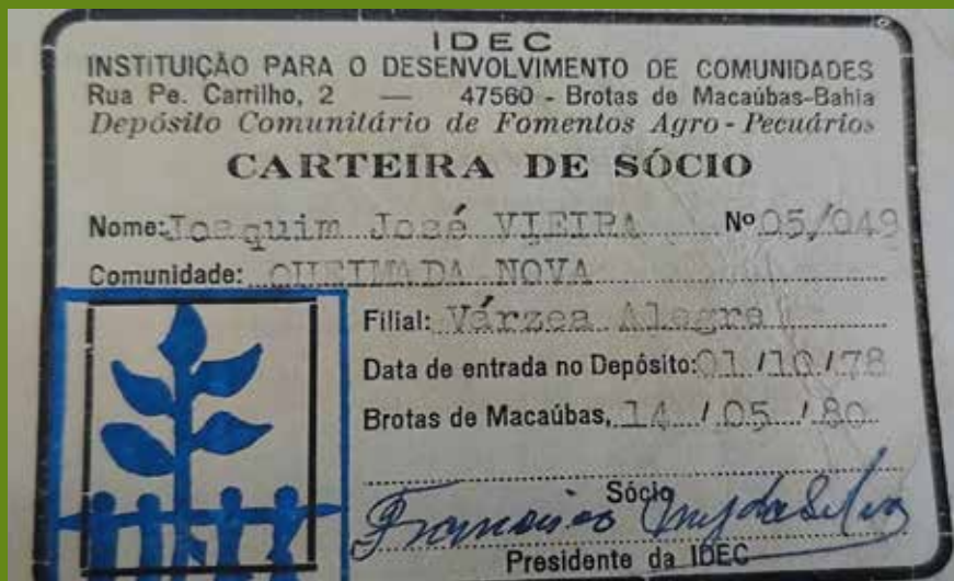
Carteira de sócio do Depósito Comunitário da IDEC