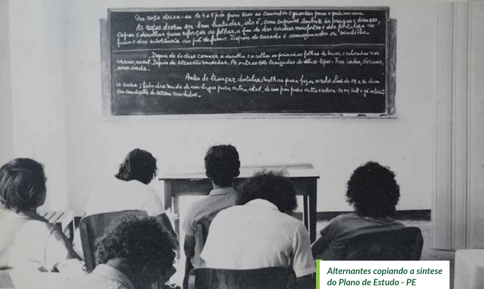
Alternantes copiando a síntese do Plano de Estudo - PE

Mas foram os trabalhos comunitários desenvolvidos pela equipe da ECR que me permitiram conhecer de fato a realidade vivida pelas famílias e comunidades no semiárido do Nordeste, realidade que apenas conhecia através dos estudos de geografia e história. Uma realidade que se apresentava ainda mais dura no ano de 1976 em função da ocorrência de uma grande estiagem que castigava duramente a região, o que ainda exigia mais esforço de minha parte para compreender toda essa dramática complexidade e de viver em uma situação dessa. Essa situação nos inquietava e instigava a contribuir com o projeto de educação dos jovens, suas famílias e comunidades, com o propósito de transformar essa realidade em melhores condições de vida para a população. Esses trabalhos comunitários e visitas as famílias, que representavam uma ação muito forte da ECR, foram fundamentais para a nossa interação e direcionamento dos temas tratados no plano de formação dos estudantes e nas orientações às famílias, respeitando e valorizando os saberes e experiências dos sujeitos locais, através do nosso papel de animadores.