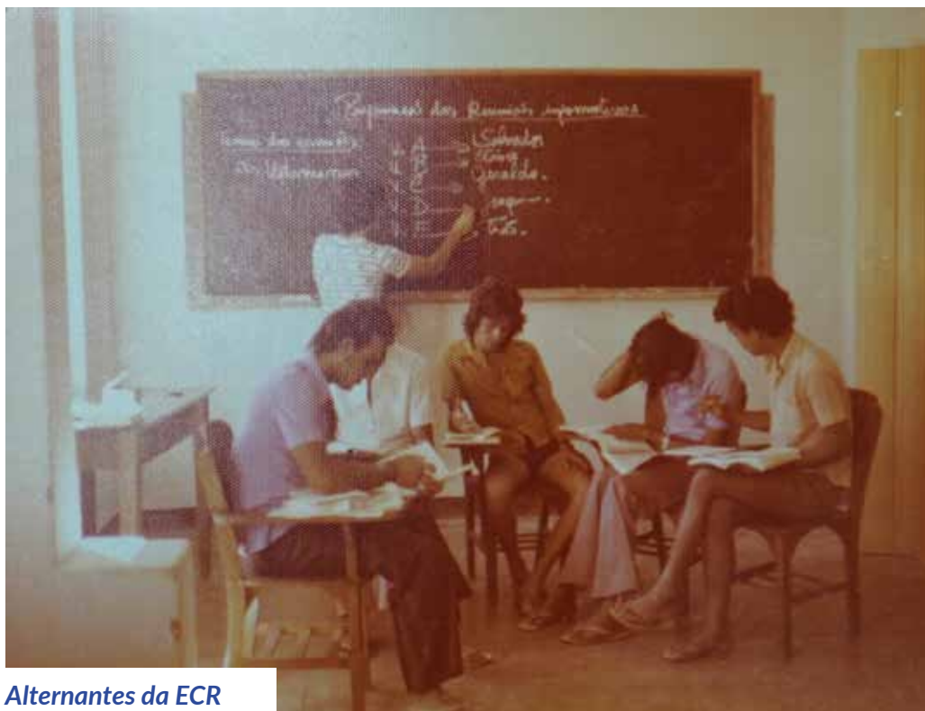
Alternantes da ECR em sala de aula

A pedagogia em si, a interação escola/comunidade, as aulas, tudo levava à formação cidadã e integral. Esses jovens passavam a ver o trabalho comunitário, a produção agropecuária, e o mundo ao redor, sob outra ótica e perspectiva, e, conseqüentemente, atuavam em suas comunidades na orientação e na prática da agropecuária com métodos mais adequados e eficazes, acabando com a cultura das queimadas anuais nas roças, por exemplo, visando também a proteção ambiental, bem como proporcionando uma alimentação saudável e variada às pessoas, e também uma oportunidade de aumentar a renda familiar. Era notória a contribuição dos alternantes na orientação técnica agropecuária para os agricultores nas suas comunidades e também as mudanças ali existentes.