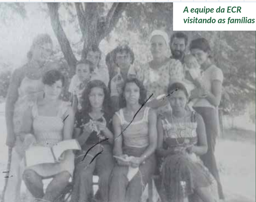
A equipe da ECR visitando as famílias