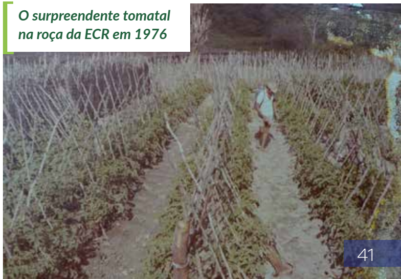
O surpreendente tomatal na roça da ECR em 1976

O meu trabalho como educador e animador comunitário na parte agrícola na ECR de Brotas foi possível graças ao apoio da equipe, dos estudantes, alguns com idade superior à minha, e das famílias, o que facilitava o debate e a troca de experiências no desenvolvimento dos conteúdos de forma contextualizada e vinculados a realidade deles. Isso permitiu viver experiências significativas para a minha vida pessoal e profissional, dentre as quais destaco algumas: a) Projeto de produção da propriedade agrícola da ECR , com destaque para o exitoso e surpreendente projeto de produção de hortaliças, que