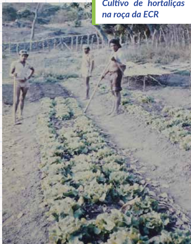
Cultivo de hortaliças na roça da ECR

da escola, bem ao lado da casa onde ficavam hospedados os alunos e os monitores, e onde, efetivamente, funcionava a escola. Essa convivência mais de perto com as alunas e os alunos, criava entre nós uma camaradagem incrível. Apreciava, todos os dias à tardezinha, eles/elas molhando os canteiros de verduras e legumes em um terreno ao fundo da casa Maria Goretti. Plantações essas, com aspecto, tamanho e vivacidade como nunca se tinha visto antes na região. Foi aí que virei “lagarta” e aprendi a comer folhas! A comer verduras e legumes! (Obrigada, ECR)! Inclusive, por várias vezes, atendi pessoas da cidade que vinham comprar as lindas e deliciosas alfaces e demais hortaliças produzidas pelos alternantes. Aliás, foi através da escola que, assim como eu, muitas pessoas do município e região passaram a conhecer e degustar a variedade de hortaliças, que antes nem sabíamos que existia.