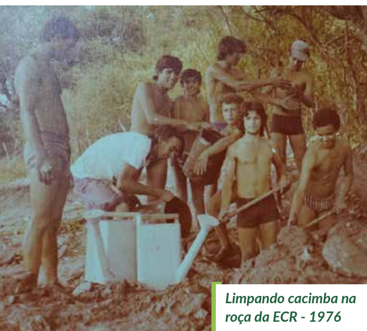
Limpendo cacimba na roça da ECR - 1976

É um modelo de escola que faz o estudante ver o problema e procurar a sua resolução. Faz abrir os olhos na busca de novos caminhos, que outrora eram impossíveis de serem pensados. Estimula o estudante a procurar novos conhecimentos que venham a enriquecer o seu aprendizado. Foram muitas as visitas realizadas em outras regiões, o que são chamadas de visitas de estudo, e até visita a