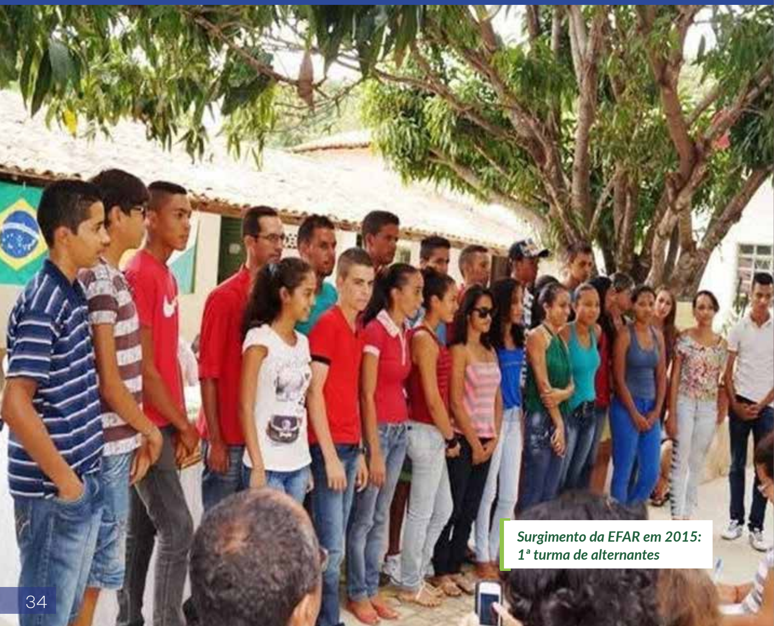
Surgimento da EFAR em 2015: 1ª turma de alternantes