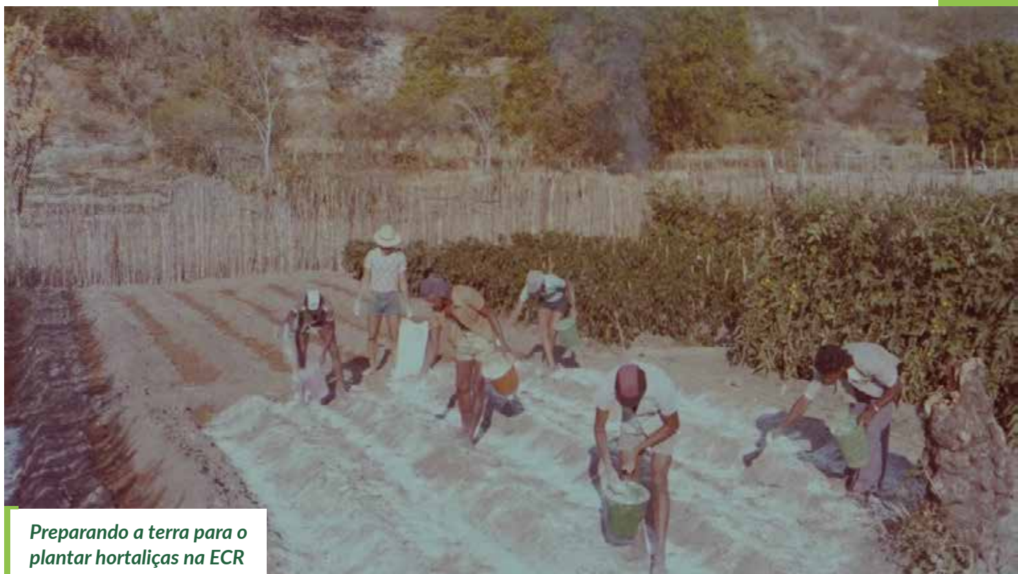
Preparando a terra para o plantar hortaliças na ECR

horta e comprar diretamente os seus produtos colhidos na hora, o que dava muita satisfação para a equipe.