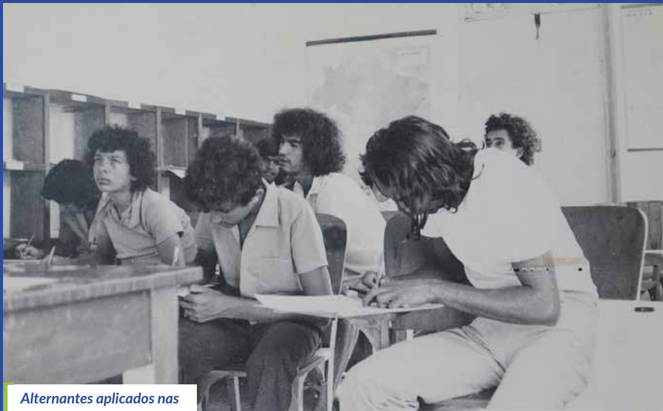
Alternantes aplicados nas aulas teóricas na ECR