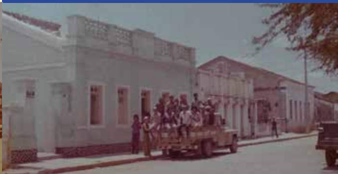
Casa onde funcionou a ECR (1975-1994)

Existe algo surpreendente na história da Pedagogia da Alternância no mundo e no Brasil. De fato, poucos imaginavam que a iniciativa, um tanto quanto inusitada e revolucionária, de um vigário e de alguns de seus paroquianos camponeses, pais de famílias, num vilarejo rural do interior da França nos anos trinta do século XX (vinte) (há noventa anos), ia se desenvolver e se multiplicar, em pouco tempo, a ponto de ganhar o mundo e se tornar referência obrigatória na Educação do Campo.