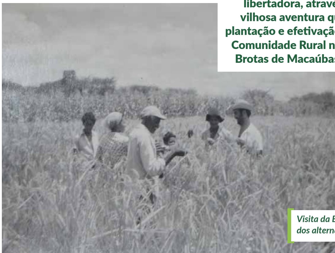
Visita da ECR na roça dos alternantes

Agricultoras e agricultores, pais de família, jovens que trilharam os caminhos de uma educação libertadora, através da maravilhosa aventura que foi a implantação e efetivação da Escola Comunidade Rural na região de Brotas de Macaúbas, na Bahia.