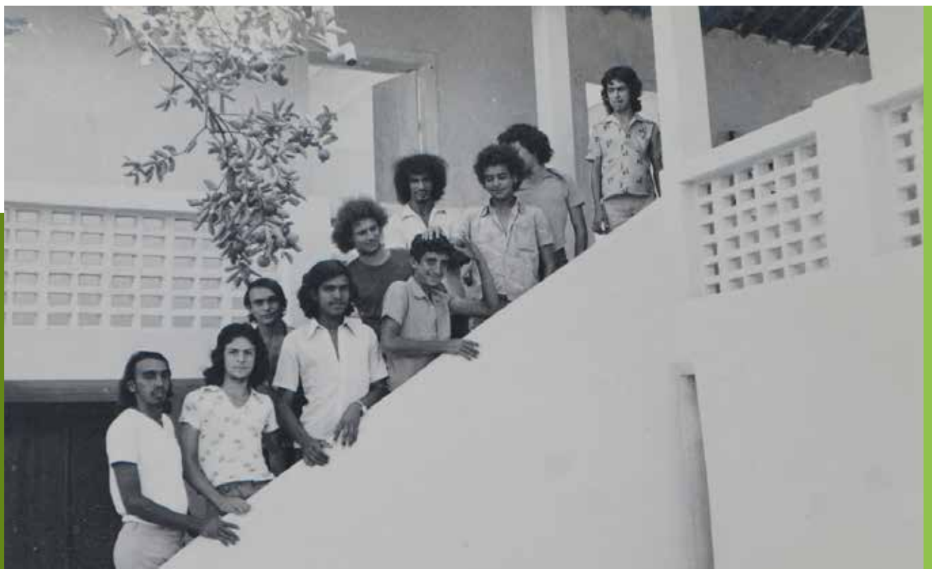
1ª turma da ECR (1975-1976)

1974, preparando-se para estruturar a escola. Nesse mesmo ano, o MEPES apoiou a iniciativa e enviou uma equipe a Brotas para participar de reuniões com as comunidades, levando ao debate a Pedagogia da Alternância e a proposta da EFA. Esses diálogos ocorreram ainda em 1974. Em seguida, um projeto foi elaborado e enviado a organizações cooperantes e apoiadores estrangeiros. Uma organização alemã e um grupo de belgas financiaram a compra da casa e da roça onde se instalaria a Escola. Logo depois, foi estruturado o projeto pedagógico e, em 1975, iniciou-se a primeira turma. Assim nasceu a Escola Comunidade Rural.