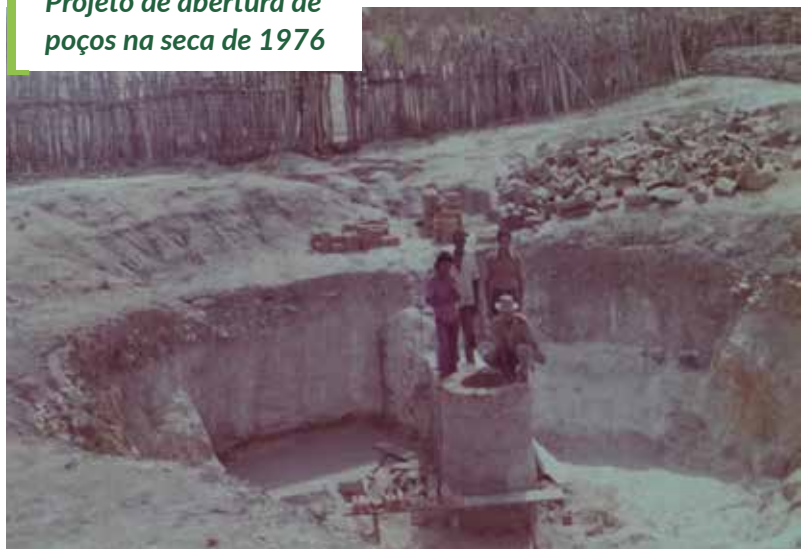
Projeto de abertura de poços na seca de 1976

Foi lembrado que na seca severa de 1976, projetos de poços manuais na Boa Sorte, no Arroz, na Várzea da Pedra, no Largo e na Queimada Nova e de distribuição de sementes de feijão amenizaram o sofrimento do povo e dos animais. (imagem GOV055)