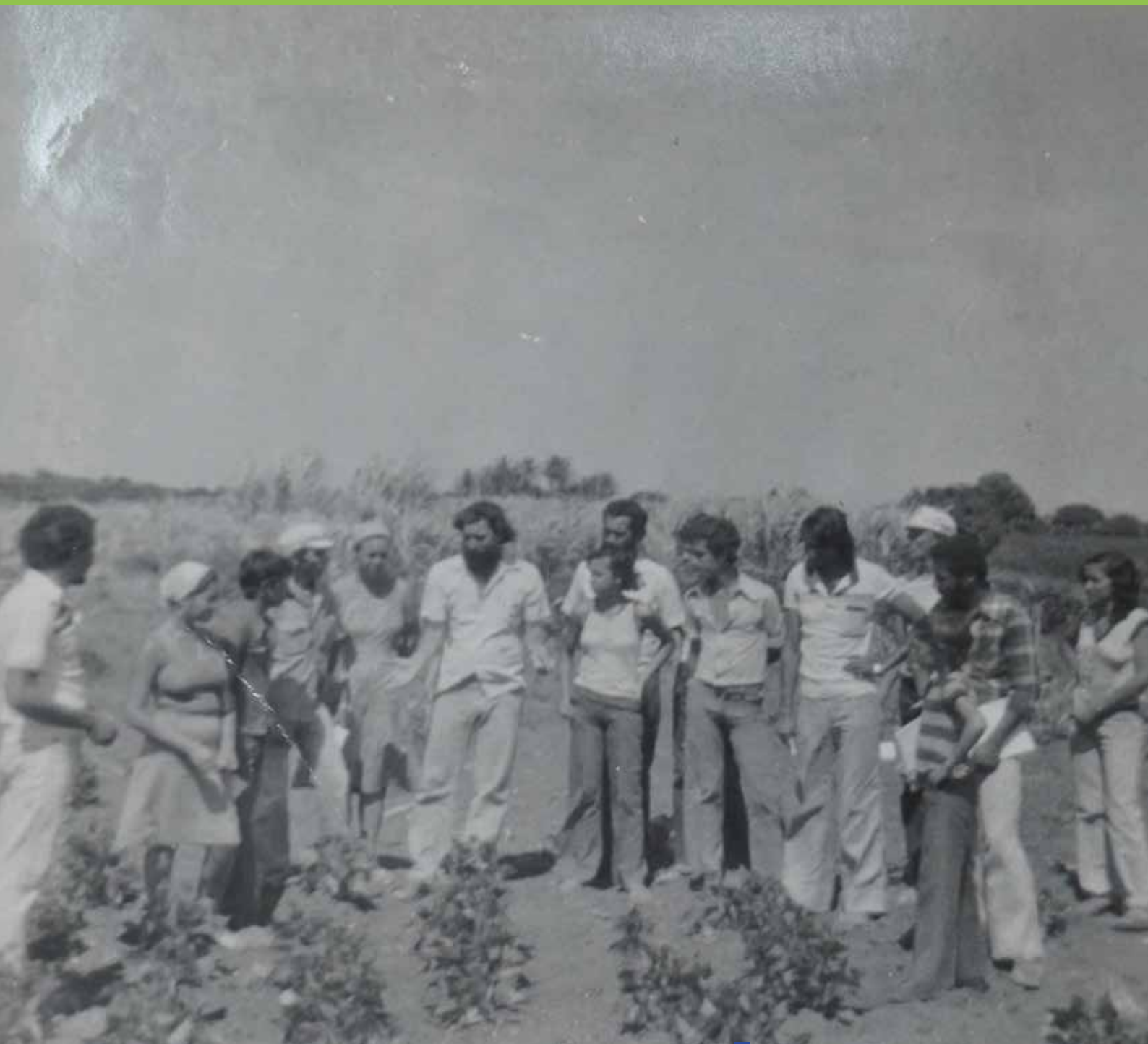
Turma de alternantes em Visita de Estudo