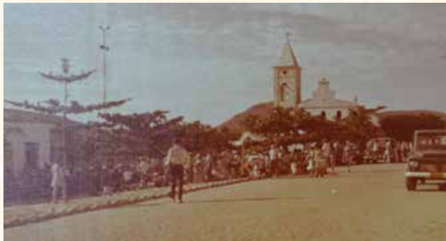
Dia de feira em Brotas nos anos 70