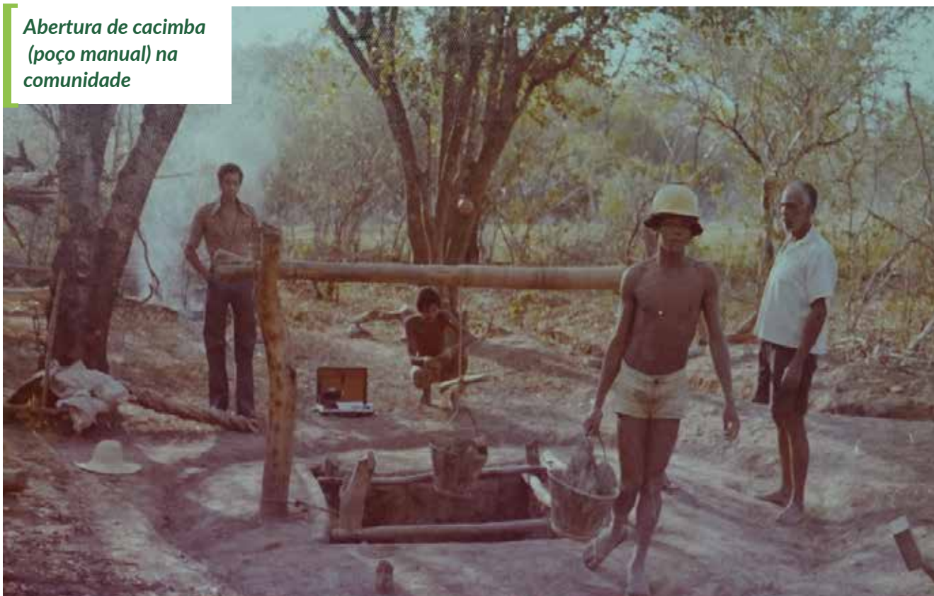
Abertura de cacimba (poço manual) na comunidade