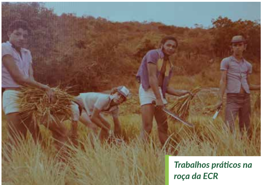
Trabalhos práticos na roça da ECR

Novas culturas experimentadas nas comunidades