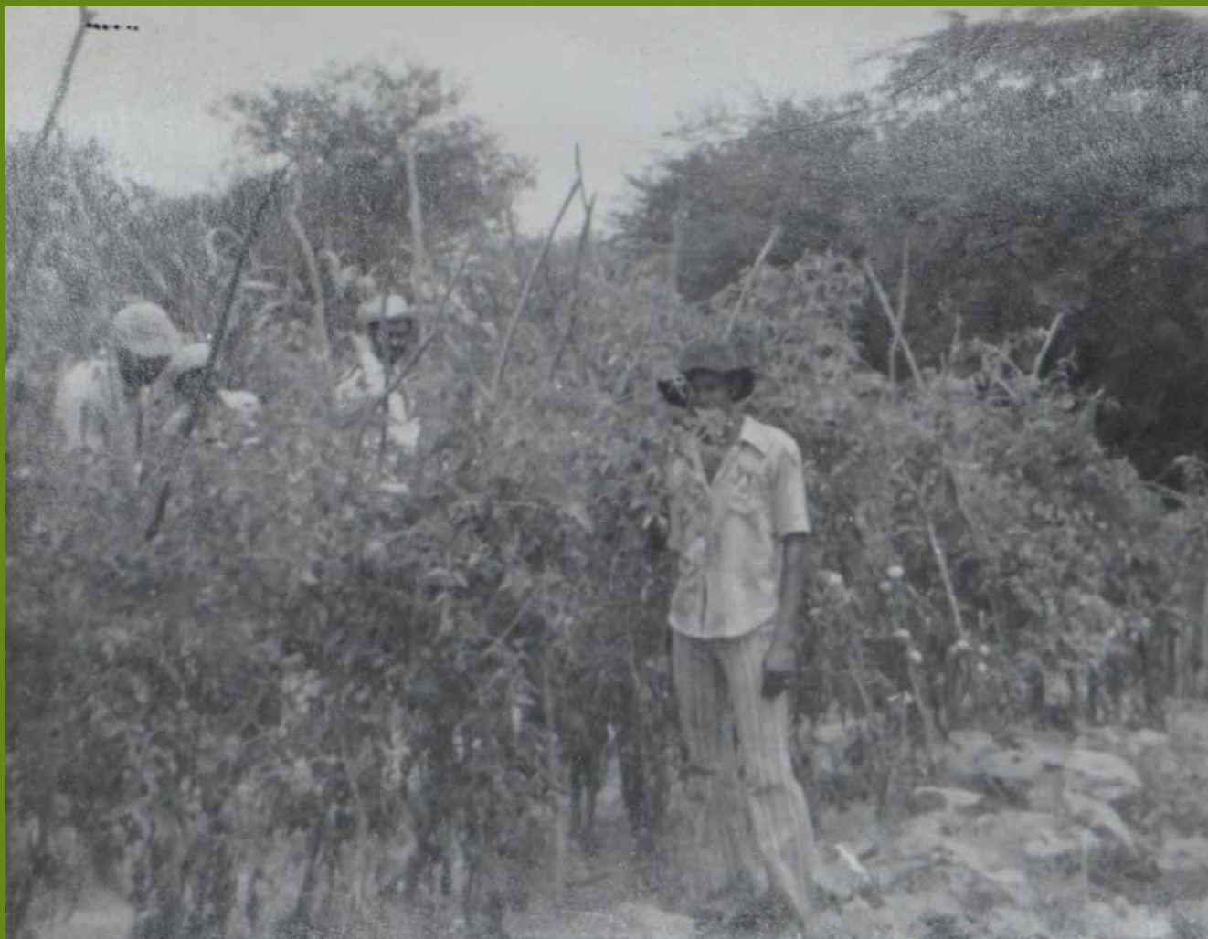
Agricultor recebendo a ECR em sua roça

O curso de formação contextualizada, com duração de 2 anos, garantiu a juventude rural apropriar-se do conhecimento da realidade local e nacional, das tecnologias apropriadas e de convivência com o semiárido, da sua integração e vivência comunitária, incentivando o jovem rural a permanecer no campo, contribuindo desta forma para o desenvolvimento local e reduzindo o êxodo rural.