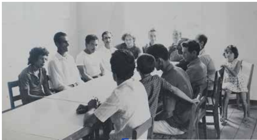
O 1º Conselho de Administração da ECR em 1975

Mesmo tendo maioria de agricultores na sua Diretoria (imagem Gov094), bem como na sua Assembleia Geral, a IDEC, embora facilitando o início de atividades novas e permitindo o entrosamento de certa faixa populacional não integrada na pastoral executada pela Paróquia, ficava presa na sua grande maioria e por dispositivos estatutários específicos e irrevogáveis, às influências da mesma e de seus esquemas próprios, contrariando assim, pelo menos em parte, um dos princípios fundamentais