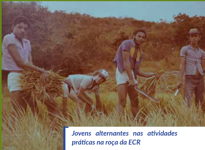
Jovens alternantes nas atividades práticas na roça da ECR

Na ECR, algumas ações se destacaram entre as demais para caracterizar a vivência do quarto princípio das EFAS, referente à ação comunitária para o desenvolvimento sustentável e solidário: a produção de hortaliças de todo tipo, tanto na própria ECR bem como nas roças dos/das alternantes em suas comunidades; a introdução de práticas pioneiras para com o trato dos animais, a exemplo de vacinas e sais minerais; introdução de equipamentos agrícolas desconhecidos ou ainda pouco utilizados na região; projetos de emergência contra a seca (poços e sementes); a criação de um depósito comunitário de fomentos agropecuários de grande repercussão na região por causa dos preços módicos de ferramentas e produtos veterinários e que chegou a contar em 1978 com “180 membros e com seis filiais nas comunidades de Brotas, Mata, Novo Horizonte, Sodrelândia, Lagoa de Dentro e Várzea Alegre”, passando ao número expressivo de 600 sócios em 1980.